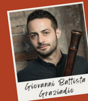
Giovanni Battista Graziadio