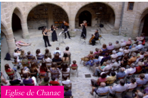
Eglise de Chanac