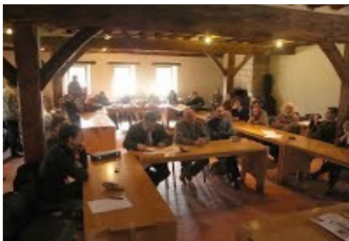
AG 2012 Saint-Rémy-lès-Chevreuse

Adhérer à ERTA-France permet d'échanger des expériences pédagogiques , de parler de sujets liés à notre métier d'enseignant , d'avoir un retour sur le monde de la flûte à bec avec nos collègues . Cet échange est constructif, motivant pour l'enseignement.