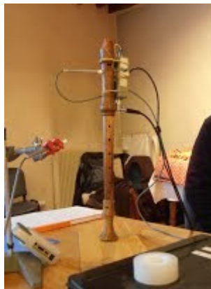
Flûte à bec de laboratoire

Tarif réduit aux concerts de nos adhérents.