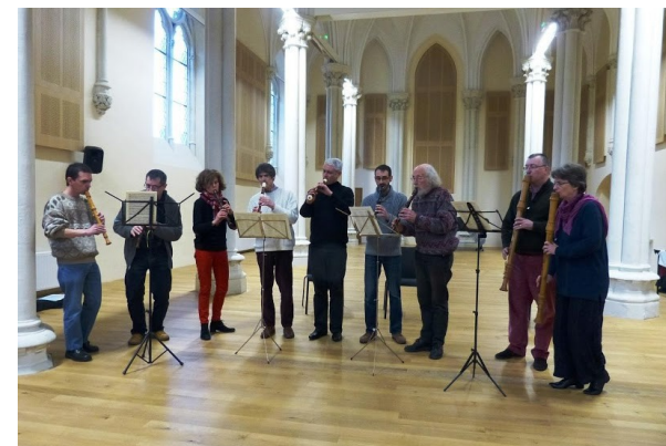
Le CA lors du congrès 2013 (Laval)

Association des musiciens- enseignants la flûte à bec